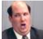
gerardo tecé @gerardotc

Cuando algún empresario donaba dinero a la caja B del PP era por altruismo y amor a España, sin esperar ningún contrato público a cambio