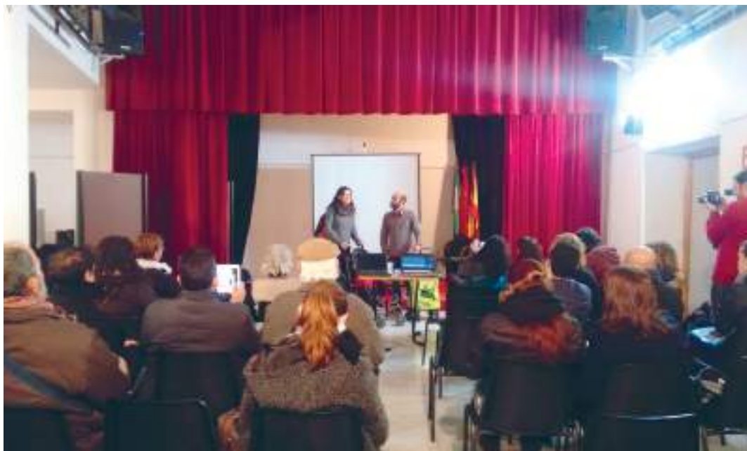
Presentación de la campaña www.reparaentucole.org