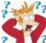
Anacleto Panceto @Xuxipc

La Audiencia Nacional no ha decretado prisión para Luis Bárcenas porque no ha encontrado ningún chiste de Carrero Blanco escrito por él.